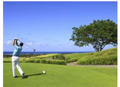
8 AMAZING GOLFING HOLIDAYS WORLDWIDE | HAYES & JARVIS