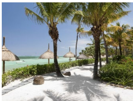
VOGUE | VOYAGES ET SI ON PASSAIT L'ÉTÉ À L'ÎLE MAURICE?